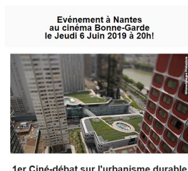
1er Ciné-débat sur l'urbanisme durable