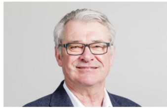
▲ Jean-Paul Chapron, PDG d'ASI et député régional Pays de la Loire Syntec Numérique.

En pleine croissance avant la crise sanitaire, les entreprises du numérique sont entrées dans une zone de turbulence avec le confinement. Dans les Pays de la Loire, comme dans le reste de la France, elles sont confrontées à une baisse d'activité, toutefois plus ou moins accentuée selon leur taille et leur métier.